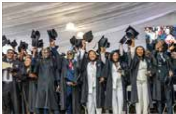
Die 622 Absolventinnen und Absolventen des Jahrgangs 2025 der Africa University feiern am 7. Juni in Mutare, Simbabwe.

Mit Kollekten im April und Mai übernehmen 30.000 Gemeinden weltweit Verantwortung für die theologische Ausbildung! Eine neue Generation von Pastorinnen und Pastoren und anderen Führungskräften der Evangelisch-methodistischen Kirche in Afrika, Europa und auf den Philippinen soll ihre Bildungschance erhalten. In einigen Gegenden haben weniger als 5 % der Pastoren und Pastorinnen eine theologische Ausbildung, daher ist die Förderung dringend notwendig.